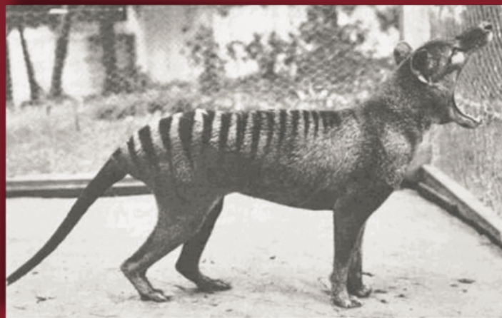
"Benjamin", fascinant marsupial au look canin, dernier Thylacine, disparu en captivité le 7 septembre 1936.

Des parcours sont tantôt tristes, tantôt à rire aux éclats, mais toujours à rester rêveur.se. Et ils sont réellement vécus et dépassent parfois l'imagination.