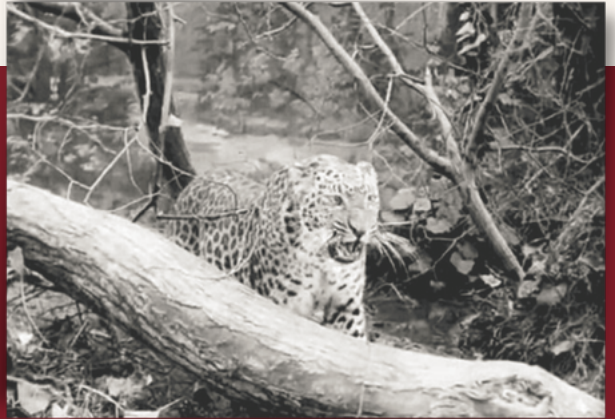
Mimir, star du cinéma muet au studio d'Alfred Machin, cinéaste belge du début du XXe siècle. Mimir a vécu à Molenbeek.

Ceci supposera une salle occultable et une aide à la régie lumière. L'ensemble devrait néanmoins rester assez léger pour pouvoir tourner dans des lieux peu équipés.